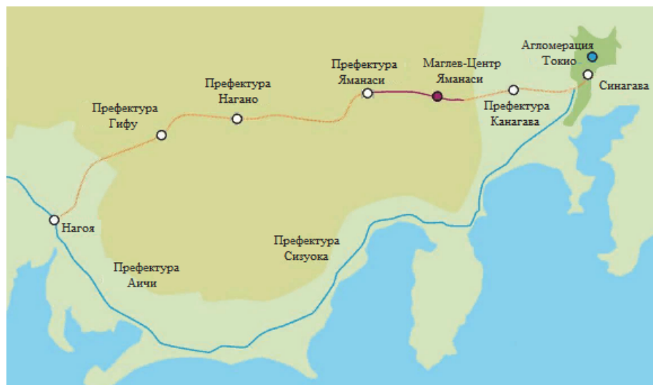
Рис.1. Линия между станциями Синагава (Токио) и Нагоя, строительство которой планируется на первом этапе проекта «Тюо-Синкансэн»

В Японии запущено строительство железнодорожной инфраструктуры комплексного проекта «Тюо-Синкансэн» с использованием поездов на магнитном подвесе. Строящаяся дорога будет являться альтернативой для действующей линии Токайдо-Синкансэн, соединяющей Токио, Нагоя и Осаку, которая имеет крайне сложный маршрут, проходящий через гористую местность, расположенную вдоль побережья и изобилующую поворотами и перепадами высот (рис. 1). Открытие движения запланировано на 2027 г.